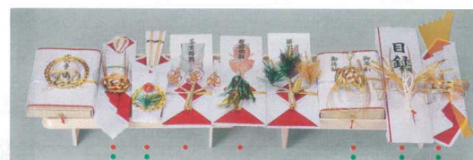
優結納セット 11-337-46 9品揃(台2台) ¥75,000 (W570・D305・H205) (実寸W960・D280・H130) 11-337-47 7品揃(台2台) ¥71,000 (W570・D305・H130) (実寸W960・D280・H130) ●印の7品 11-337-48 5品揃(台1台) ¥68,000 (W525・D280・H125) (実寸W480・D280・H130) ●印の5品