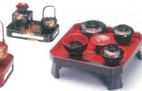
黒内朱 箸付 喰初セット 松竹梅 11-337-27 ¥15,000 (W260・D260・H100)