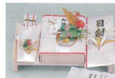
11-337-44 ニュータイプ華やぎ結納セット ¥65,000 (W1,425・D315・H165) (実寸W375・D315・H65)