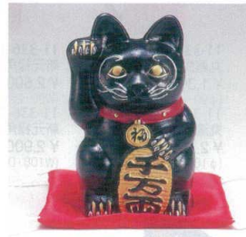
11-337-21 招き猫(黒) ¥11,000 (W102・D91・H156)