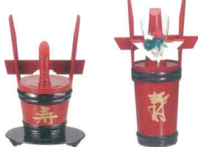
朱 台付ガラス瓶入 角樽 11-337-40 ¥48,000 (W280・D205・H425) (実寸W185・D185・H380)