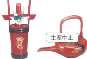
朱 1升瓶用 角樽 寿 11-337-41 ¥39,000 (W180・D180・H316) (実寸W168・D168・H510)