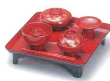
朱 喰初セット 鯛 11-337-30 ¥9,800 (W265・D265・H100) (実寸W248・D248・H570)