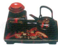
屠蘇器 四ツ揃 枠足 暁雲 松竹梅 11-337-24 ¥11,100 鏡子台W115・D115・H125、鏡子W200・D115・H165 台W333・D228・H42、箱寸W385・D275・H180 蓋・大φ100、中φ90、小φ70