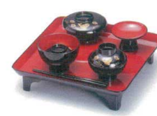
黒 喰初セット 鯛 11-337-31 ¥9,800 (W265・D265・H100) (実寸W248・D248・H570)