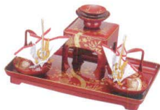
朱 17.0 婚礼セット 松竹梅(鏡子飾り付) 11-337-22 ¥99,000 (W530・D320・H260)