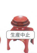
朱 盃・盃台 松竹梅 11-337-43 ¥5,800 (W130・D120・H120) (実寸W125・D110・H110) φ100・φ85・φ75