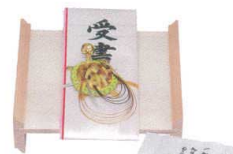
11-337-45 ニュータイプ華やぎ受書セット ¥21,000 (W300・D270・H113) (実寸W240・D225・H60)