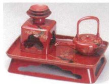
赤口 新胴張 四ツ揃 梅台 11-337-28 ¥45,000 (W410・D290・H240)