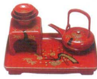
屠蘇器 四ツ揃 枠足 洗朱 松竹梅 11-337-23 ¥11,100 鏡子台W115・D115・H125、鏡子W200・D115・H165 台W333・D228・H42、箱寸W385・D275・H180 蓋・大φ100、中φ90、小φ70