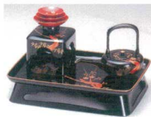
黒 新胴張 四ツ揃 梅台 11-337-29 ¥45,000 (W410・D290・H240)