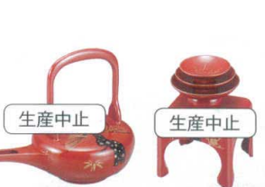
朱 鏡子 松竹梅 11-337-42 ¥6,200 (W190・D175・H130) (実寸φ120・D200)