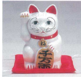
11-337-20 招き猫(白) ¥11,000 (W102・D91・H156)