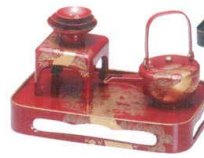
松クリ 四ツ揃 屠蘇器 老松 11-337-25 黒 ¥52,500 11-337-26 本朱 ¥52,500 (W400・D270・H225)