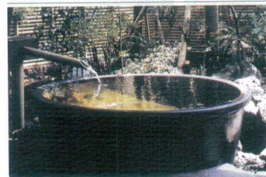
11-343-11K ①丸型口口成型 焦ゲ窯変 φ1,150・H600