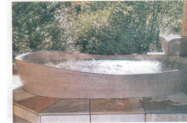
11-343-16K ⑥小判型手捻り成型 あかねず W1,500・D800・H580