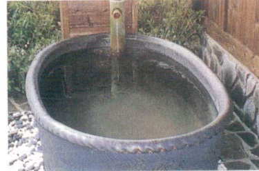
11-343-6K ③小判型手捻り成型 焦ゲ窯変 W1,300・D850・H580