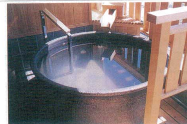
11-343-15K ①丸型口口成型 焦ゲ窯変 φ1,150・H600