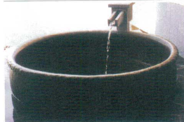
11-343-8K ③丸型手捻り成型 焦ゲ窯変 φ1,200・H600