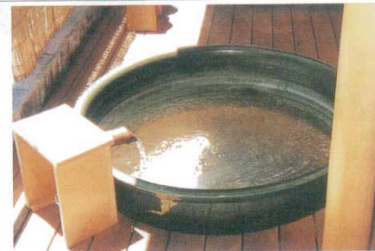
11-343-12K ①丸型口口成型 織部 φ1,150・H600