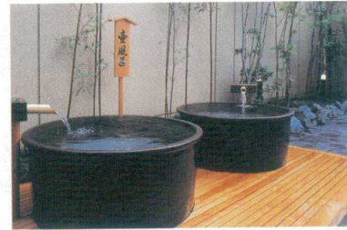
11-343-3K ①丸型口口成型 焦ゲ窯変 φ1,150・H600