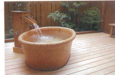
11-343-4K ③丸型手捻り成型 炎色二彩 φ1,400・H800