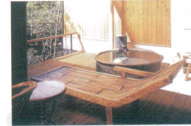
11-343-13K ③丸型手捻り成型 焦ゲ窯変 φ1,150・H600