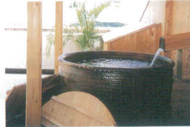
11-343-9K ⑥丸型手捻り成型 火色三彩 φ1,150・H550