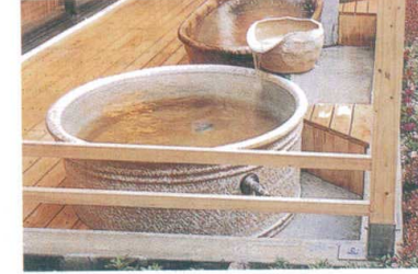
11-343-10K ⑦丸型手捻り成型 白炎色二彩 φ1,150・H580