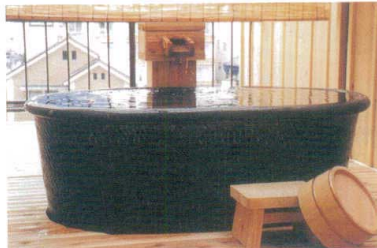
11-343-5K ⑤小判型手捻り成型 焦ゲ窯変 W1,500・D800・H580