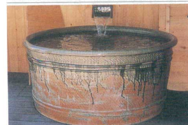
11-343-14K ⑦丸型手捻り成型 炎色二彩ヒードロ φ1,250・H600