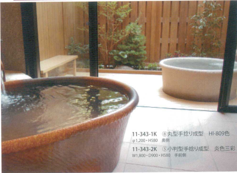
11-343-1K ⑥丸型手捻り成型 HI-809色 φ1,200・H580 奥側 11-343-2K ⑤小判型手捻り成型 炎色三彩 W1,800・D900・H580 手前側