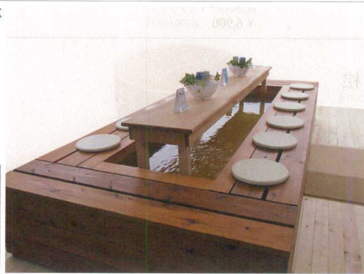
浴槽・周囲の座面及びテーブル全て木製です 機械ユニットは別置きになります