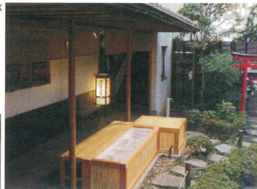
FRP 製浴槽を桧の木枠に収めたタイプです 機械ユニット内臓のオールインワンタイプです