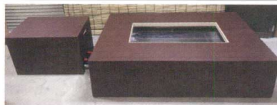
標準の仕様 (木目調)

11-346-4K おもてなし足湯 サイズ : 木枠の外寸 W1,900×D1,300×H420mm 機械室部 W 800×D 700×H700mm 電源 : 三相 100V×1.75KW (ノンヒューズ、ブレーカー付き単独回路) 利用人数: 6人 本体重量: 95kg (機械ユニット35kg) 運転重量: 280kg 運転水量: 180L 標準仕様: 空転防止回路、高温警報回路、 ろ過塩素減菌装置付き ※設置場所に合わせたサイズに変更可能です。