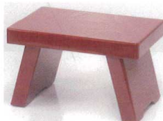
11-351-11K 朱風呂椅子(小) ¥ 7,800 W250・D165・H150 ABS ウレタン塗装