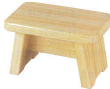
11-351-7K 風呂椅子白木塗(大) ¥ 12,800 W340・D220・H300 ABS ウレタン塗装