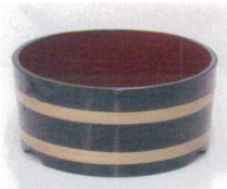
11-351-9K 湯桶 黒内朱 ¥ 7,000 φ220・H100 ABS ウレタン塗装