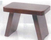
11-351-15K ケヤキ色風呂椅子(小) ¥ 7,800 W250・D165・H150 ABS ウレタン塗装