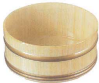
11-351-5K 湯桶白木塗 ¥ 3,200 φ220・H100 ABS ウレタン塗装