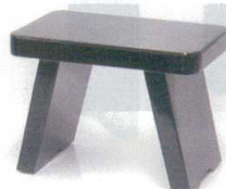
11-351-13K 黒風呂椅子(小) ¥ 7,800 W250・D165・H150 ABS ウレタン塗装