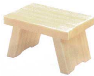
11-351-2K 風呂椅子(小) ¥ 5,300 W250・D165・H150 ABS