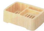
11-351-4K シャンプー箱 ¥ 2,450 W230・D165・H77 ABS