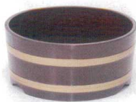
11-351-10K 湯桶 ケヤキ色 ¥ 6,000 φ220・H100 ABS ウレタン塗装