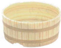
11-351-1K 湯桶 ¥ 3,200 φ220・H100 ABS