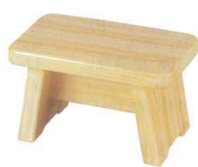
11-351-6K 風呂椅子白木塗(小) ¥ 8,400 W300・D180・H192 ABS ウレタン塗装