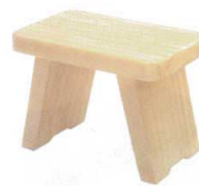
11-351-3K 風呂椅子(大) ¥ 9,000 W300・D187・H222 ABS