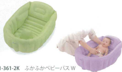
ふかふかベビーバス

11-361-2K ふかふかベビーバス W ¥ 4,500 W680・D470・H290 対象/象/新生児～3ヵ月頃まで 適用身長/60cmまで 材質/塩化ビニル樹脂(食品衛生法対応可塑剤使用) カラー/グリーン・パープル ※サイズは空気の量により多少異なります。