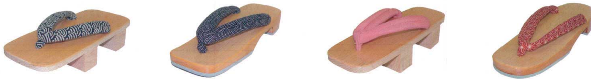
11-388-18K L男角経木張塗り ¥ 6,250 (25.5cm) 花緒/布(波柄) 11-388-19K 桧男ソフト経木張塗り ¥ 7,260 (25cm) 花緒/布(小紋柄) 11-388-20K L女日光経木張塗り ¥ 5,910 (24cm) 花緒/布(チリメンピンク) 11-388-21K 桧女ソフト経木張塗り(底ゴム付) ¥ 7,090 (24cm) 花緒/布(麻の葉)