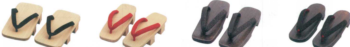
11-388-26K 桐男角張磨き黒ハイミロン ¥ 7,600 (25.5cm) 花緒/布 11-388-27K 桐女角張磨き赤ハイミロン ¥ 7,260 (24cm) 花緒/布 11-388-28K 桐L男ソフト焼磨 ¥ 8,440 (26cm) 花緒/印伝(布) 11-388-29K 桐L女ソフト焼磨 ¥ 8,270 (24cm) 花緒/印伝(布)