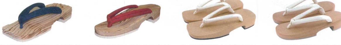
11-388-22K 杉L男木目ソフト(底ゴム付) ¥ 6,750 (25cm) 花緒/布 ※鼻緒柄が変更になります 11-388-23K 杉L女木目ソフト(底ゴム付) ¥ 6,590 (24cm) 花緒/布 ウレタン花緒(紺無地) 11-388-24K 桐男ソフト張磨 白デラ ¥ 8,950 フリーサイズ (26cm) 花緒/白 11-388-25K 桐女ソフト張磨 白デラ ¥ 8,610 フリーサイズ (24cm) 花緒/白