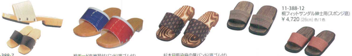
11-388-7 アニリンゼット自然木使用(底ゴム付) ¥ 2,340 (S,M) 色/アイボリー・ブラック 11-388-8K ¥ 4,220 (24cm) 色/赤・青・緑 11-388-9K ¥ 4,560 (25.5cm) 色/赤・青・緑 11-388-10K ¥ 4,900 (M,L) 色/1色 11-388-11K ¥ 5,070 (LL) 色/1色 11-388-12 桐フィットサンダル紳士用(スポンジ底) ¥ 4,720 (26cm) 色/1色 11-388-13 桐フィットサンダル婦人用(スポンジ底) ¥ 4,720 (24cm) 色/1色