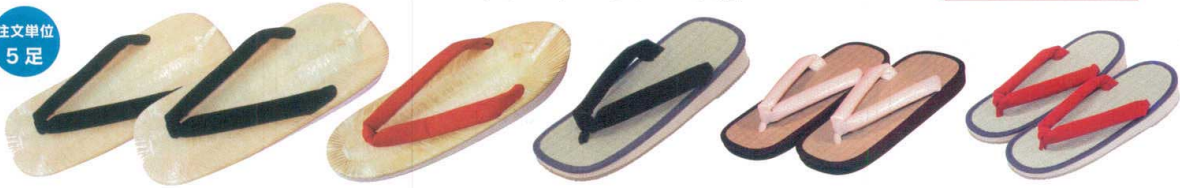
紳士用セッタ 11-388-1 ¥ 1,950 (L・約25cm) 花緒/白・黒 11-388-2 ¥ 2,800 (LL) 花緒/白・黒 11-388-3 婦人用セッタ ¥ 1,850 (L・約23.5cm) 花緒/赤 11-388-4 紳士用セッタ ¥ 2,930 (約26cm) 花緒/黒(布) 11-388-5 紳士用セッタ ¥ 2,930 (約26cm) 花緒/白(ビニールレザー) 11-388-6 婦人用セッタ ¥ 2,930 (約24cm) 花緒/赤(布)