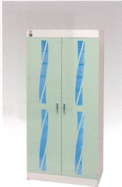
11-390-3 ¥ 590,000 (W700・D400・H1,500) 重量: 58kg 収納足数: 20足