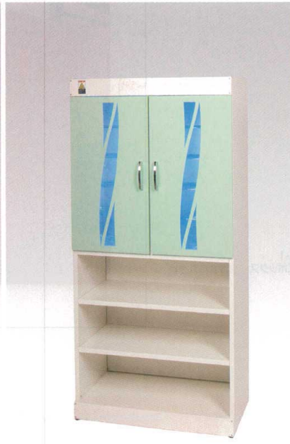
11-390-2 ¥ 440,000 (W700・D400・H1,500) 重量: 55kg 収納足数: 10足+下足棚付