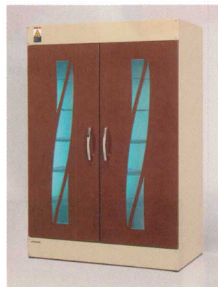
11-390-5 ¥ 380,000 (W600・D330・H900) 重量: 30kg 収納足数: 12足

特長 ・全面アルミ反射板内装、網柵仕様により、360度どの角度からでも殺菌できます。 ・殺菌ランプの直視を防ぐ安全設計です(窓はUVカット材を使用し、扉開閉検知センサー付)。 ・5種類のラインナップから、施設のニーズにあったサイズをお選びいただけます。