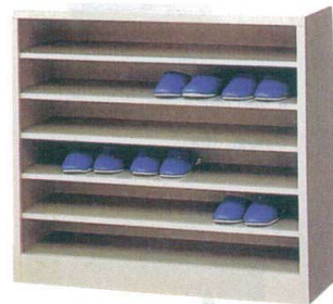
11-391-5 スリッパボックス (別途見積り) 木製