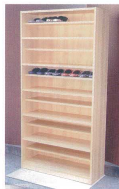
11-391-8 下駄入れ (別途見積り) 木製