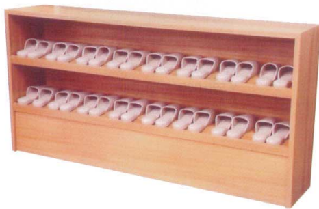
11-391-3 下駄入れ (別途見積り) 木製