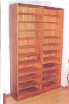
11-391-9 下駄入れ (別途見積り) 木製

このページの商品は、別途見積り商品になります。 品番、サイズなど、お気軽にお問い合わせ下さい。 ご発注の際にはくれぐれもご確認の上、必ずFAXにてご注文下さいませお願い申し上げます。 発注後のキャンセルは、お受けできません。