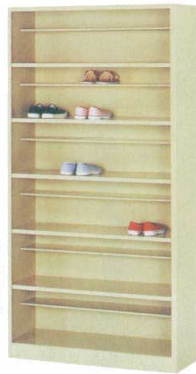
11-391-1 スリッパボックス (別途見積り) 木製