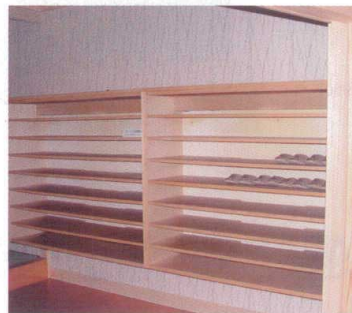
11-391-7 下駄入れ (別途見積り) 木製