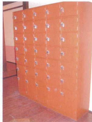
11-391-2 カギ付下駄入れ (別途見積り) 木製