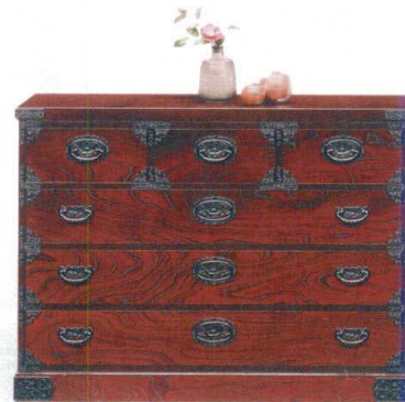
11-394-6 整理 ¥ 220,000 (W1,200・D455・H900)