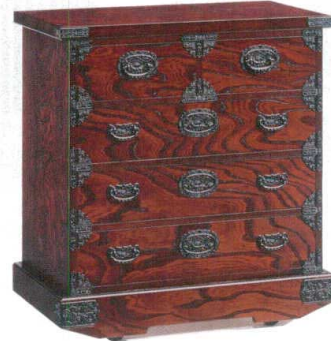
11-394-3 車タンズ ¥ 216,500 (W900・D455・H950) 車付き