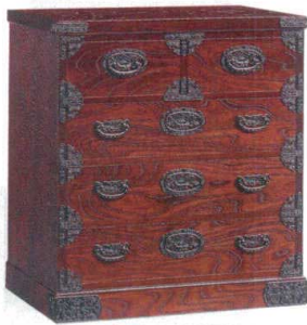
11-394-4 整理 ¥ 171,000 (W750・D455・H900)