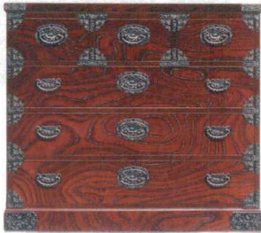
11-394-1 整理 ¥ 211,000 (W1,050・D455・H900)