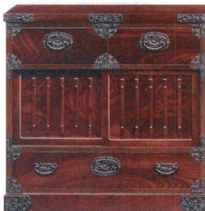
11-394-7 振場タンズ ¥ 227,500 (W900・D455・H900)