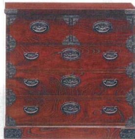
11-394-5 整理 ¥ 182,000 (W900・D455・H900)