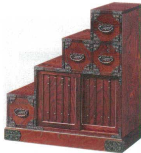
11-394-9 階段左下がり ¥ 182,000 (W830・D445・H900)