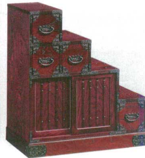
11-394-10 階段右下がり ¥ 182,000 (W830・D445・H900)