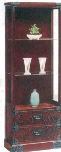
11-396-8 飾り棚 ¥ 142,500 (W600・D385・H1,700)