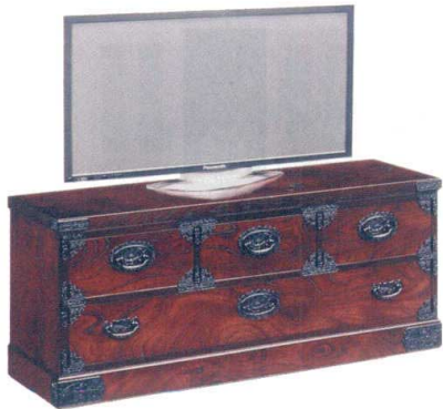
11-396-1 整理2段 ¥ 122,500 (W1,200・D455・H510)