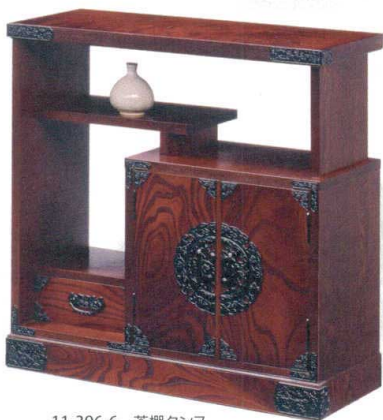
11-396-6 茶棚タンス ¥ 140,000 (W880・D385・H900)