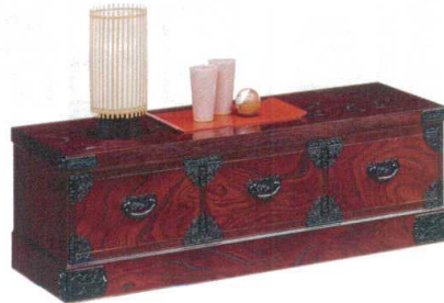
11-396-2 チェスト ¥ 80,000 (W1,200・D455・H340)