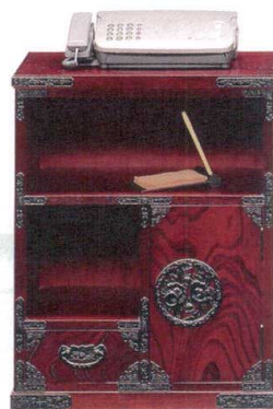
11-396-7 TEL 台 ¥ 126,000 (W598・D385・H754)