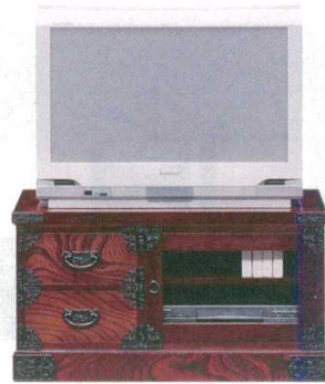
11-396-3 TV台 ¥ 120,000 (W900・D455・H480)