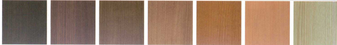
ES-1 オーク A ES-2 オーク B ES-3 ウォールナット A ES-4 ウォールナット B ES-5 チェリー ES-6 メープル ES-7 アッシュ