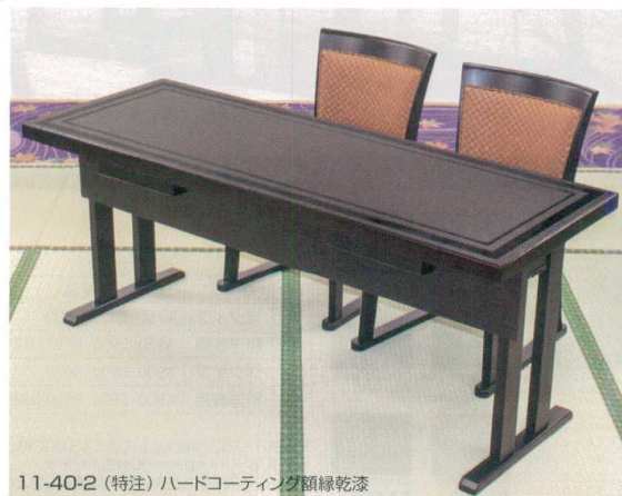
11-40-2 (特注) ハードコーティング額縁緑乾漆