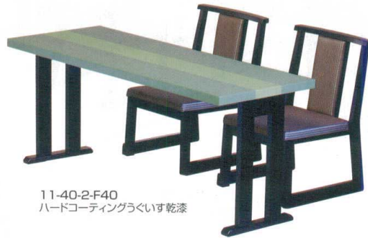
11-40-2-F40 ハードコーティングうくいす乾漆