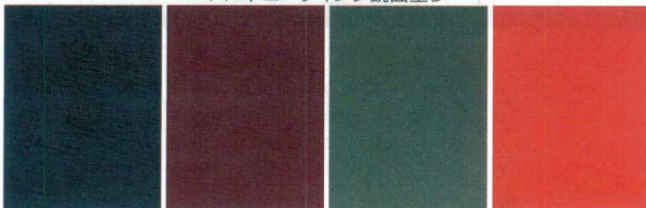
G40 黒鏡面塗 G41 うるみ鏡面塗 G42 グリーン鏡面塗 G43 朱鏡面塗