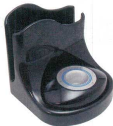
11-406-5 スリム型送信機ナプキン立付 ¥26,900 (W105・D105・H105) ブラック