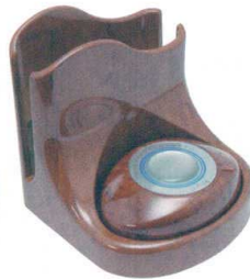
11-406-6 スリム型送信機ナプキン立付 ¥33,000 (W105・D105・H105) 木目