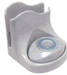
11-406-8 スリム型送信機ナプキン立付 ¥33,000 (W105・D105・H105) マールグレー