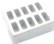
11-406-2 専用充電器(10台用) ¥157,300 (W141・D58・H182) 接点充電式 ACアダプター付属