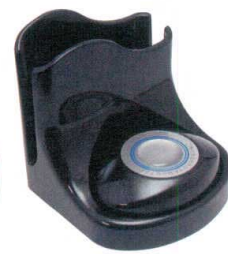
11-406-7 スリム型送信機ナプキン立付 ¥33,000 (W105・D105・H105) パールブラック