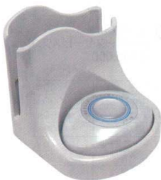
11-406-4 スリム型送信機ナプキン立付 ¥26,900 (W105・D105・H105) ライトグレー