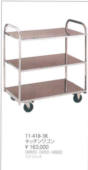
11-418-3K キッチンワゴン ¥ 163,000 (W800・D450・H860) ステンレス