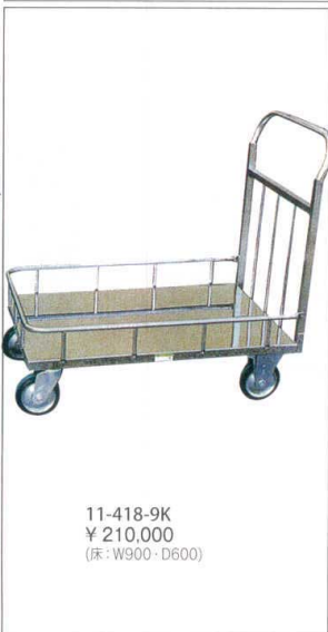
11-418-9K ¥ 210,000 (床: W900・D600)