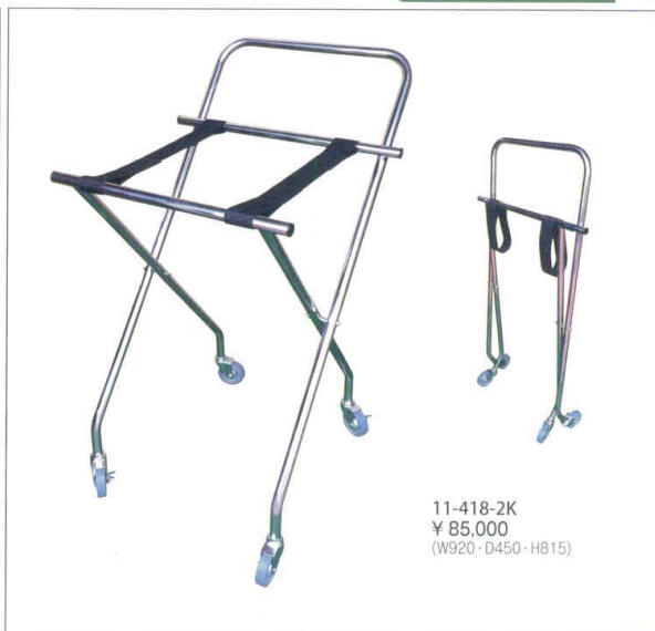
11-418-2K ¥ 85,000 (W920・D450・H815)