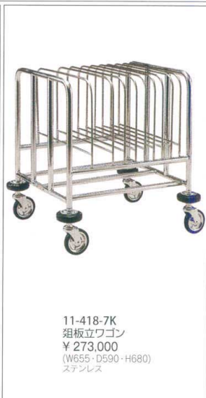
11-418-7K 組板立ワゴン ¥ 273,000 (W655・D590・H680) ステンレス