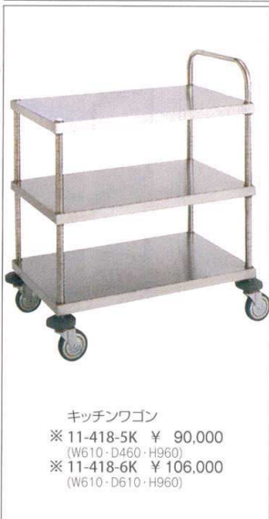
キッチンワゴン ※ 11-418-5K ¥ 90,000 (W610・D460・H960) ※ 11-418-6K ¥ 106,000 (W610・D610・H960)