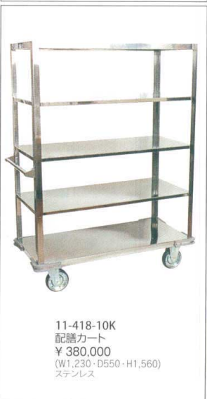
11-418-10K 配膳カート ¥ 380,000 (W1,230・D550・H1,560) ステンレス