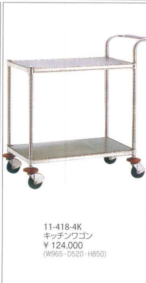
11-418-4K キッチンワゴン ¥ 124,000 (W965・D520・H850)