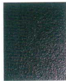
11-43-2 B2 メラミン細目黒