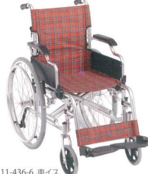
11-436-6 車イス ¥92,000 (W670・D980・H865)