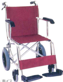
11-436-4 車イス ¥56,400 (W660・D980・H870)