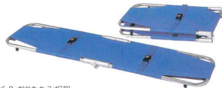
11-436-9 おりたたみ担架 ¥138,000 (W1,900・D490・H60)