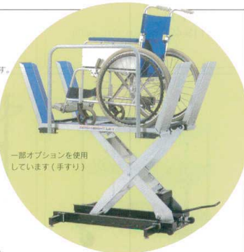
一部オプションを使用しています(手すり)