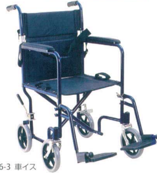
11-436-3 車イス ¥56,000 (W665・D1,050・H870)