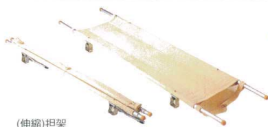
(伸縮)担架 11-436-10 スチール製 ¥40,000 11-436-11 アルミ製 ¥51,000 (W2,250・D540)