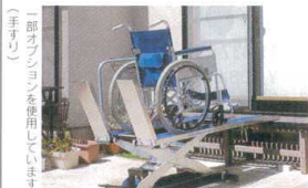
(手すり) 一部オプションを使用しています