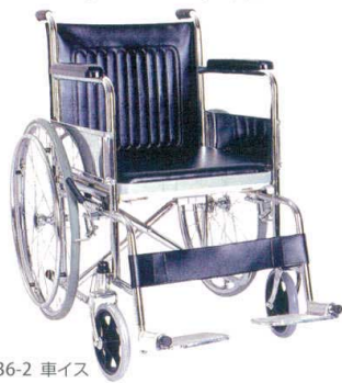
11-436-2 車イス ¥52,000 (W670・D950・H885)