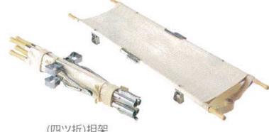
(四ツ折)担架 11-436-14 スチール製 ¥45,000 11-436-15 アルミ製 ¥53,000 (W2,030・D540)