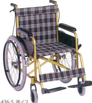
11-436-5 車イス ¥77,600 (W665・D1,060・H870)