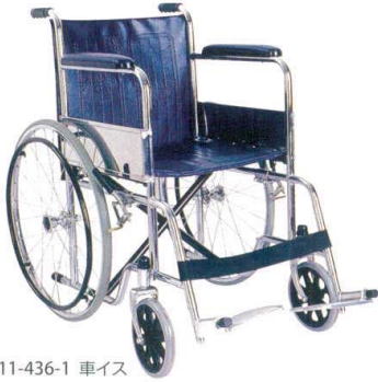
11-436-1 車イス ¥40,000 (W630・D1,070・H865)