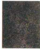
11-44-8 C8 メラミン錦梨地