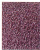
11-44-2 C4 メラミンうるみ乾漆