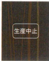
11-44-4 C9 メラミン天平梨地 艶有・凹凸なし