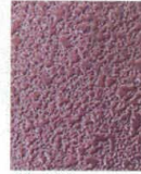
11-44-2 C4 メラミンうるみ乾漆