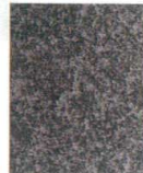
11-44-6 C7 メラミン石目黒