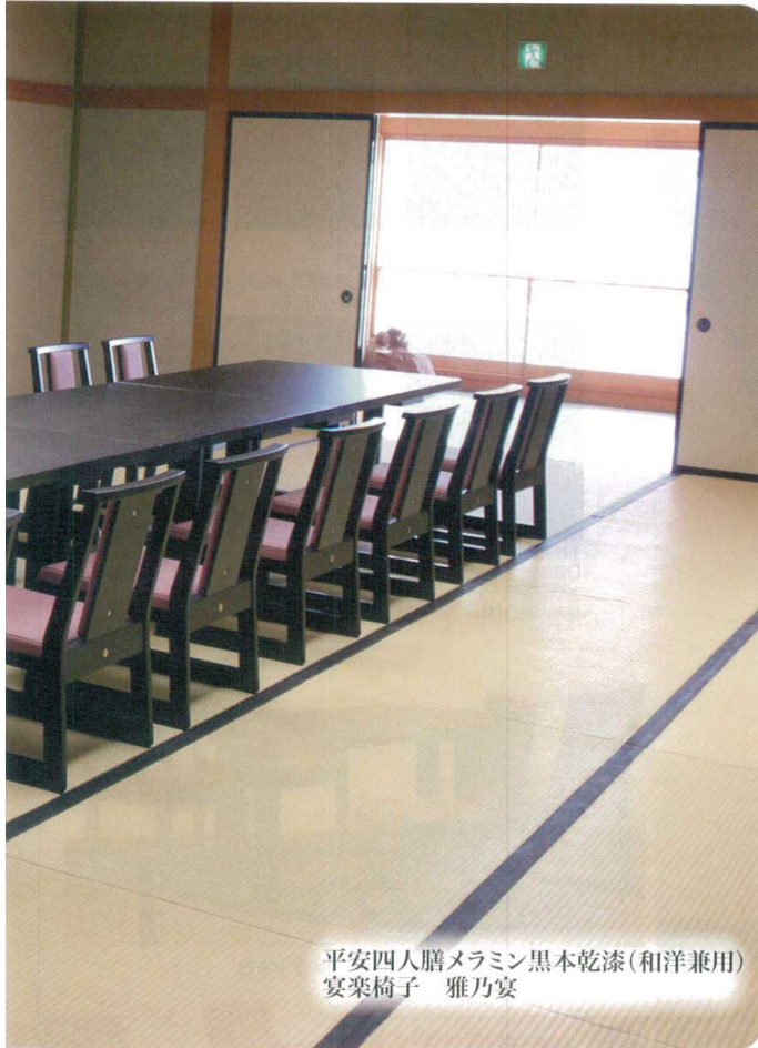
平安四人膳メラミン黒本乾漆(和洋兼用) 宴楽椅子 雅乃宴

宴楽膳・平安四人膳・平安六人膳は演漆の登録商標です 実用新案登録第3178416号 実用新案登録第3160625号