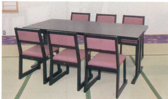
テーブルタイプ: 平安六人膳メラミン黒本乾漆 H700/宴楽椅子 雅乃宴 SH430