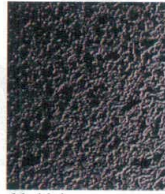
11-44-1 C3 メラミン黒本乾漆