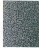
11-44-3 C5 メラミングリーン乾漆