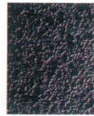
11-44-1 C3 メラミン黒本乾漆