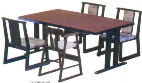
37頁参照 宴楽子供イス