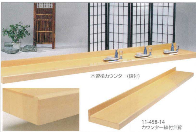
木曾松カウンター(練付)