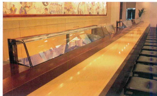
木曾松カウンター