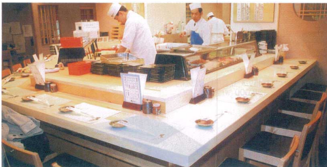
木曾松カウンター