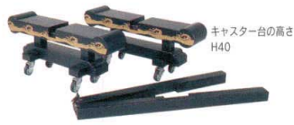
全長5mの北前舟一式(キャスター台も含) 11-460-3 ¥5,800,000 (舟腹1台のみ価格870,000円) (全長5mの北前舟の巾は120cmになります) (舟首・舟尾と舟腹は2台がセット価格となります)