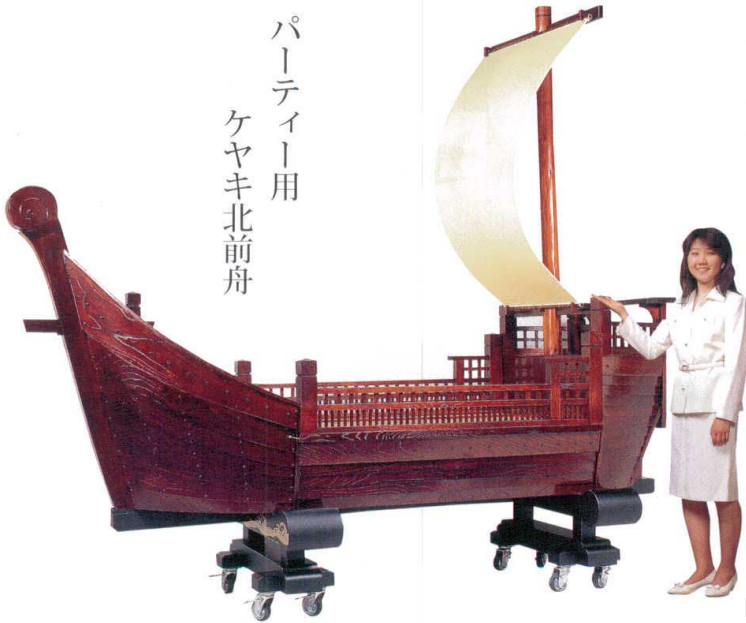
※写真は全長3mの北前舟です。パーティー会場に合わせて舟腹だけをつないで下さい。