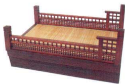
全長3mの北前舟一式(キャスター台も含) 11-460-2 ¥3,400,000 (舟腹のみ価格720,000円)