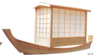
11-460-4 桧 立食パーティー用 屋形舟 ¥940,000 (全長3,000) 特注サイズは別途御見積りします。