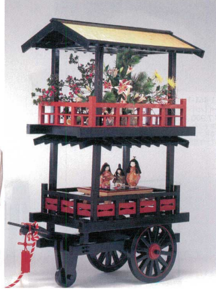
山車 組立式黒・朱塗 11-460-1 ¥1,900,000 ※写真は巾1,880×奥行1,000×H2,280(上段内寸1,030×650・下段内寸920×650) ご希望により特別サイズも受承ります。 (注)組立は2人で約1分です。