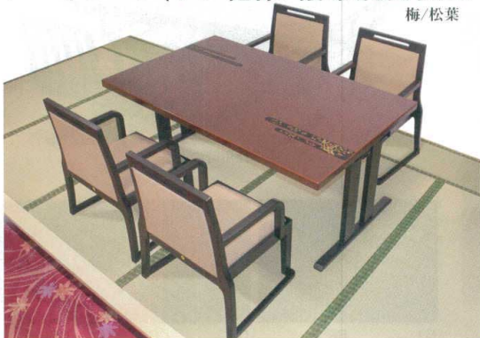
椅子GRANDシリーズ参照