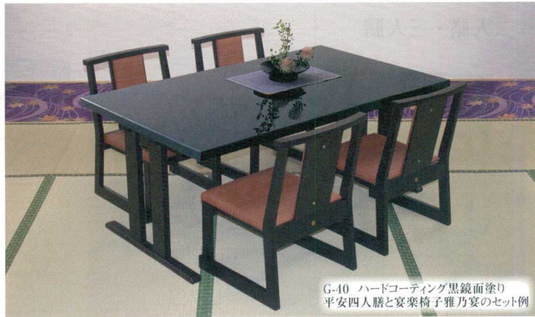
G-40 ハードコーティング黒鏡面塗り 平安四人膳と宴楽椅子雅乃宴のセット例