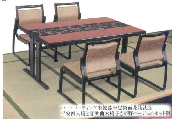
ハードコーティング朱乾漆帯黒鏡面花筏沈金 平安四人膳と宴楽曲木椅子さが野ページのセット例