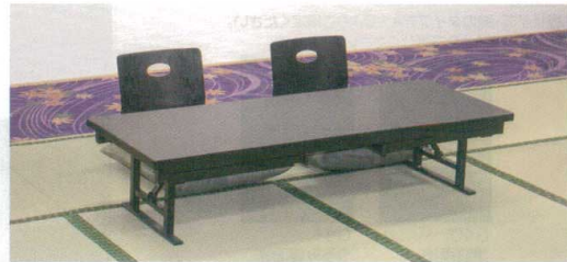
座卓使用時のイメージ

宴楽膳アルミ脚 二人膳和洋兼用 天板メラミン黒本乾漆 宴楽椅子 天竜 松島(布)