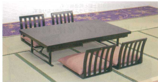
座卓使用時のイメージ

宴楽膳アルミ脚 四人膳和洋兼用 天板メラミン黒本乾漆 宴楽椅子 信濃さが野ベージュ(布)