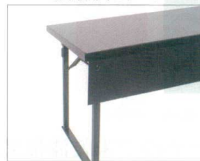
前板(オプション)装着時