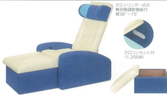
11-513-5 リラクゼーションチェア(楽音マクラ付) ¥ 225,000 チェアサイズ (W680・D690~1,100・H750~1,030・SH400) オットマンサイズ (W500・D520・H330/380) 張地516ページより2色お選び下さい。(単色も可能です。) ※マクラ内側の水色の部分は色変更不可です。