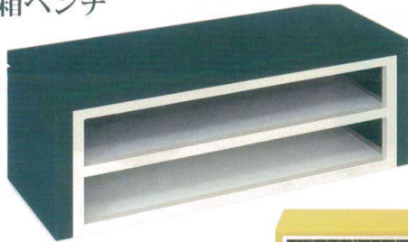
11-513-8 下駄箱ベンチ(O1) ¥ 90,000 約21kg 11-513-9 下駄箱ベンチ(O2) ¥ 112,500 約21kg サイズ(O1) W 500/600/700/800/900/1,000/1,100 D 350 H 400/450 サイズ(O2) W 1,200/1,300/1,400/1,500/1,600/1,700/1,800 D 350 H 400/450 張地516ページよりお選び下さい。