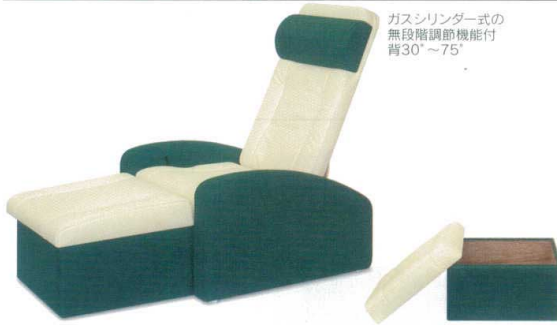
11-513-4 リラクゼーションチェア ¥ 187,500 約39kg チェアサイズ (W680・D690~1,100・H750~1,030・SH400) オットマンサイズ (W500・D520・H330/380) 張地516ページより2色お選び下さい。(単色も可能です。)