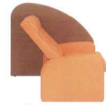
ガスシリンダー式の 無段階ポジション調節機能付 背30°~75°