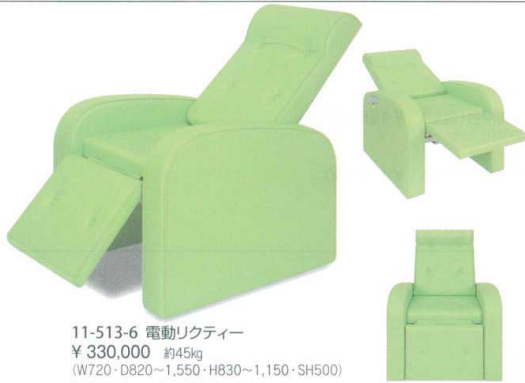
11-513-6 電動リクティ ¥ 330,000 約45kg (W720・D820~1,550・H830~1,150・SH500) 張地516ページよりお選び下さい。