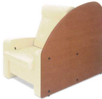
11-513-3 リクライチェア(P付き) 組立 ¥ 180,000 約41kg (W745・D690~1,100・H1,100・SH400) 張地516ページよりお選び下さい。