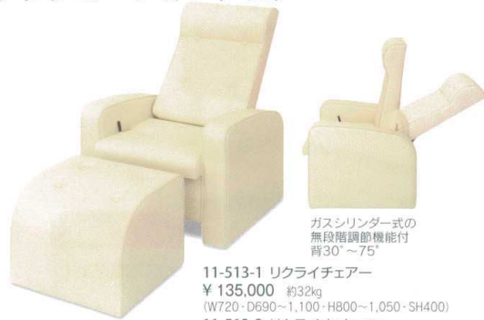
11-513-1 リクライチェア ¥ 135,000 約32kg (W720・D690~1,100・H800~1,050・SH400) 11-513-2 リクライオットマン ¥ 30,000 約7kg (W500・D450・H400) 張地516ページよりお選び下さい。