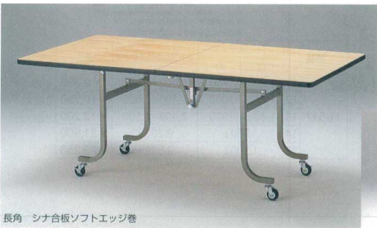
長角 シナ合板ソフトエッジ巻