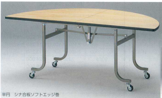
半円 シナ合板ソフトエッジ巻