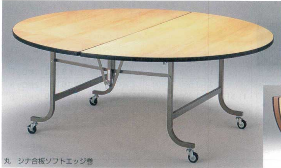
丸 シナ合板ソフトエッジ巻

共通仕様 レセプションフライト 天板/シナベニア 素ソフトエッジ巻 脚/2.6cm角パイプ 塗装 キャスター付(ストッパー付)