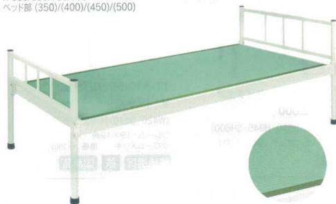
11-531-6 タタミベッド 組立 ¥165,000 約33kg (W2,060・D970・H800(ベッド部450)) スチール製/粉体塗装