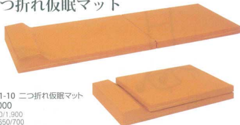
11-531-10 二つ折れ仮眠マット ¥42,000 W 1,800/1,900 D 600/650/700 クッション厚 体部分: 65 マクラ部分: 125 張地は514ページよりお選び下さい。