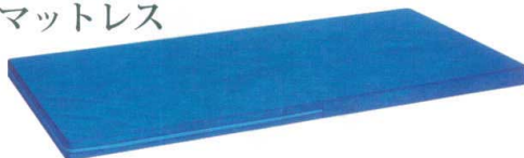
11-531-7 FAマットレス ¥34,500 約3kg W 1,810/1,910 D 780/830/910 クッション厚60 素材: ポリプロピレン不織布