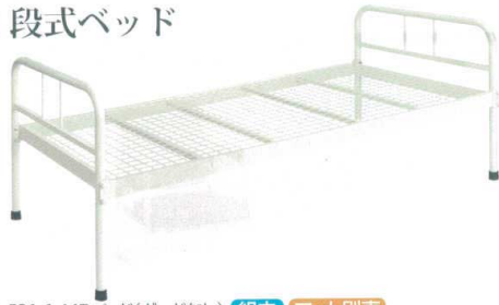
11-531-1 MBベッド(ガードなし) 組立 マット別売 ¥144,000 約35kg (W2,090・D980・H800(ベッド部450)) マット内寸(W1,910・D910) スチール製/粉体塗装