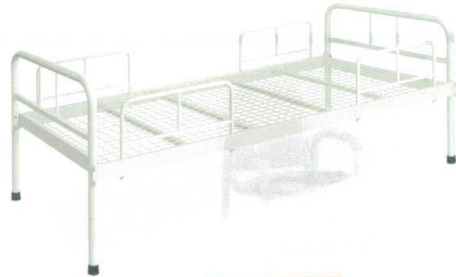
11-531-2 MBベッド(ガード付) 組立 マット別売 ¥159,000 約38kg (W2,090・D980・H800(ベッド部450)) マット内寸(W1,910・D910) スチール製/粉体塗装