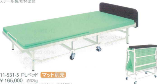
11-531-5 PLベッド マット別売 ¥165,000 約32kg 設置時(W2,000・D910・H600(ベッド部350)) 収納時(W550・D910・H1,120) スチール製/粉体塗装、ヘッドボード部レザー張 (張地は14ページよりお選び下さい。) 対応マットレス: 11-531-7・11-531-8