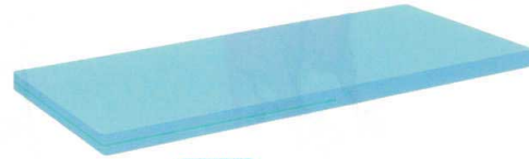
11-531-8 HAマットレス 洗濯可 ¥42,000 約4kg W 1,810/1,910 D 780/830/910 クッション厚60 材質: 綿100%(防縮加工)