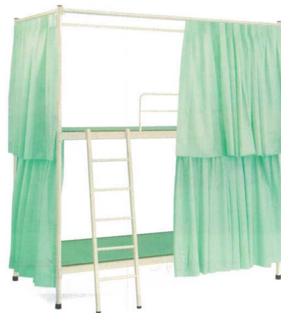
11-532-4 A-2タタミベッド(カーテン付) 組立 ¥ 420,000 約74kg (W2,060・D990・H2,230(ベッド部分 1段目:300 2段目:1,300)) スチール製/粉体塗装 畳/セキスイ美草畳