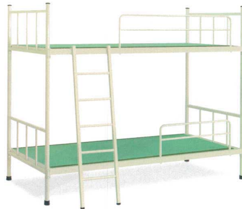
11-532-2 A-2タタミベッド 組立 ¥ 345,000 約69kg (W2,060・D990・H1,700(ベッド部分 1段目:300 2段目:1,300)) マット内寸(W1,910・D910) スチール製/粉体塗装 畳/セキスイ美草畳