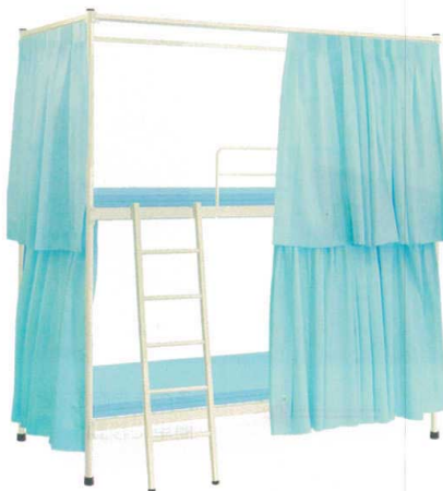
11-532-3 A-2ベッド(カーテン付) 組立 マット別売 ¥ 330,000 約70kg (W2,060・D990・H2,230(ベッド部分 1段目:300 2段目:1,300)) マット内寸(W1,910・D910) スチール製/粉体塗装