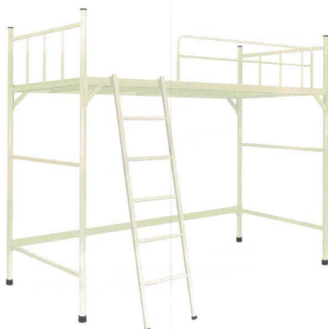
11-532-5 A-3ロフトベッド 組立 マット別売 ¥ 195,000 約45kg W2,060・D990 H1,700/1,800/1,900/2,000 ベッド部分(1,300)/(1,400)/(1,500)/(1,600) スチール製/粉体塗装 片側ベッドガード1本標準装備