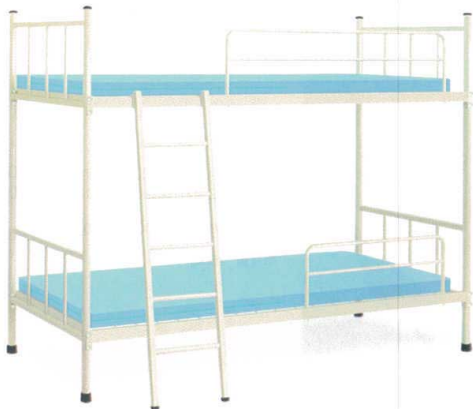
11-532-1 A-2ベッド 組立 マット別売 ¥ 255,000 約65kg (W2,060・D990・H1,700(ベッド部分 1段目:300 2段目:1,300)) マット内寸(W1,910・D910) スチール製/粉体塗装