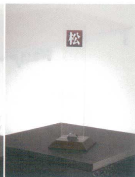
11-535-4K リザーブスタンド ¥ 47,500 ベース:木製170・170・30 プレート:透明アクリル100・500・5 表示文字:UV印刷仕上げ