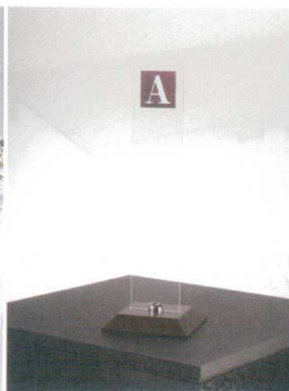
11-535-3K リザーブスタンド ¥ 41,500 ベース:木製170・170・30 プレート:透明アクリル100・500・5 表示文字:UV印刷仕上げ