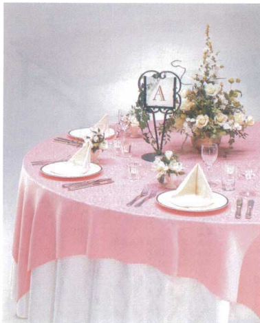
11-535-1 リザーブスタンド ¥ 30,000 H410・ベース170 プレート145・145 スチール焼付塗装 文字:シート切文字