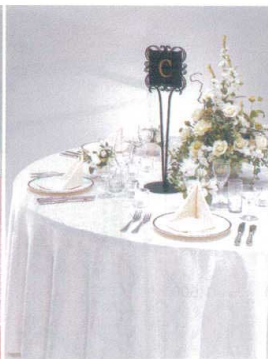
11-535-2 リザーブスタンド ¥ 33,000 H585・ベース170 プレート145・145 スチール焼付塗装 文字:シート切文字