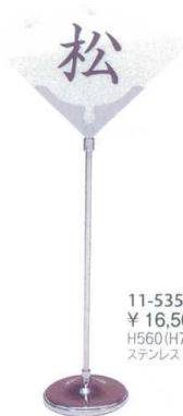
11-535-5 席札スタンド ¥ 16,500 H560(H710) ステンレス