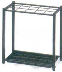
11-561-11 組立 ¥17,700 (W485・D300・H500) 本体：スチールに粉体塗装(ブラック) 傘枠：スチールに粉体塗装(ブラック) 受皿：樹脂成型品(ブラック)、大1枚