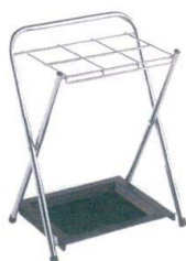
11-561-13 ミニ傘立角型 ¥8,400 (W370・D260・H480) 本体：スチールにクロームメッキ 重量：約1.9kg 折りたたみ式、傘数12本立