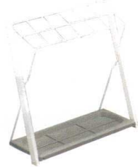
11-561-14 傘立て ホワイト ¥9,000 (W440・D190・H425) 本体：スチールに粉体塗装 受皿：ポリプロピレン(再生樹脂) 重量：約1.7kg 傘数12本立、最大3台までスタッキング可能。 受皿：再生ポリプロピレン使用(総樹脂量の10%以上)