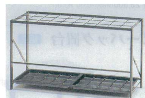
11-561-9 折り畳み式傘立て ¥17,500 (W895・D300・H500) 本体：25×12mm角パイプ 粉体塗装 傘枠：粉体塗装(差込口30) 受皿：ABS樹脂成型品