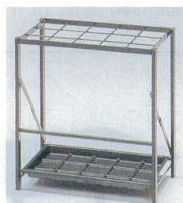
11-561-8 折り畳み式傘立て ¥12,800 (W460・D300・H500) 本体：25×12mm角パイプ 粉体塗装 傘枠：粉体塗装(差込口15) 受皿：ABS樹脂成型品