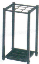
11-561-10 組立 ¥15,800 (W270・D300・H500) 本体：スチールに粉体塗装(ブラック) 傘枠：スチールに粉体塗装(ブラック) 受皿：樹脂成型品(ブラック)、小1枚