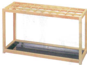
11-561-2 白木塗 30本入 ¥97,200 (W900・D300・H500)