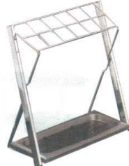
11-561-15 傘立て シルバー ¥9,750 (W440・D190・H425) 本体：スチールにクロームメッキ 受皿：ポリプロピレン(再生樹脂) 重量：約1.7kg 傘数12本立、最大3台までスタッキング可能。 受皿：再生ポリプロピレン使用(総樹脂量の10%以上)