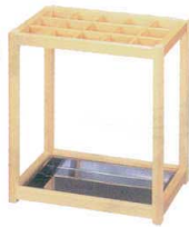
11-561-1 白木塗 15本入 ¥84,000 (W450・D300・H500)