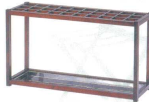
11-561-3 ケヤキ色 15本入 ¥84,000 (W450・D300・H500)