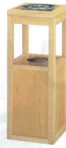
11-565-5 白木簡型(灰皿付) ✳ ¥ 70,000 (W250・D250・H650・115φ)