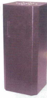
11-565-4 うるみ乾漆塗 ✳ ¥ 144,000 (W270・D270・H700)