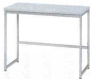
11-565-12K 組立 記載台ロータイプ ¥ 44,000 (W900・D450・H730) 本体: スチール粉体塗装 天板: 低圧メラミン化粧板(25mm厚) ローカンエッジ アジャスター付