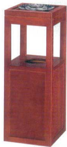
11-565-6 樺置型(灰皿付) ✳ ¥ 70,000 (W250・D250・H650・115φ)