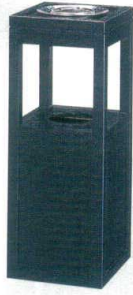
11-565-7 黒置型(灰皿付) ✳ ¥ 70,000 (W250・D250・H650・115φ)