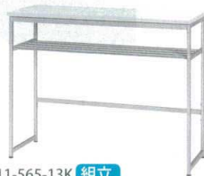
11-565-13K 組立 記載台ハイタイプ ¥ 91,000 (W1,200・D450・H950) 本体: スチール粉体塗装 天板: 低圧メラミン化粧板(25mm厚) ローカンエッジ アジャスター付