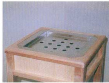
11-565-2 白木セット型 (灰皿付)(落し込み型) ¥ 138,000