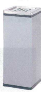
11-565-8 シルバー スモーキングスタンド ¥ 20,100 (□240・H600) 本体: 鋼板 アクリル塗装 フタ: ステンレスヘアライン仕上げ カラー: ブラック・アイボリー