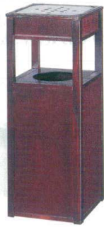
11-565-3 樺色セット型(灰皿付) ✳ ¥ 117,500 (W270・D270・H700)