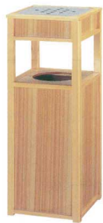
11-565-1 白木セット型(灰皿付) ✳ ¥ 117,500 (W270・D270・H700)