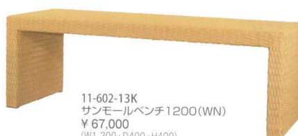
11-602-13K サンモールベンチ1200(WN) ¥67,000 (W1,200・D400・H400)