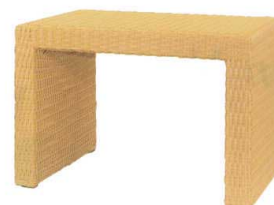
11-602-10K サンモールベンチ600(WN) ¥45,000 (W600・D400・H400)