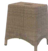
11-602-4 角スツール(NA) ¥39,000 (W400・D300・H440)