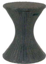
11-602-1K スツール(DB) ¥24,000 (φ360・H465)