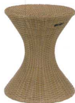
11-602-2K スツール(NA) ¥24,000 (φ360・H465)