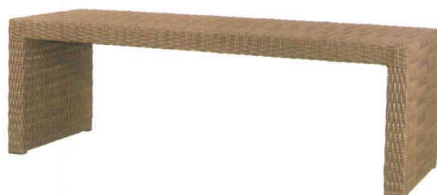
11-602-12K サンモールベンチ1200(NA) ¥67,000 (W1,200・D400・H400)