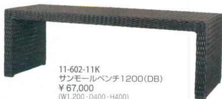
11-602-11K サンモールベンチ1200(DB) ¥67,000 (W1,200・D400・H400)