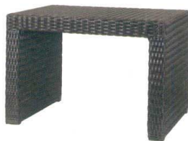
11-602-8K サンモールベンチ600(DB) ¥45,000 (W600・D400・H400)