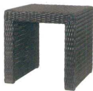
11-602-5K サンモールベンチ400(DB) ¥30,000 (W400・D400・H400)