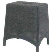
11-602-3 角スツール(DB) ¥39,000 (W400・D300・H440)