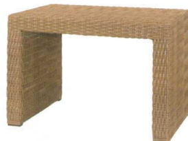
11-602-9K サンモールベンチ600(NA) ¥45,000 (W600・D400・H400)