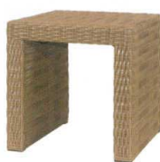
11-602-6K サンモールベンチ400(NA) ¥30,000 (W400・D400・H400)