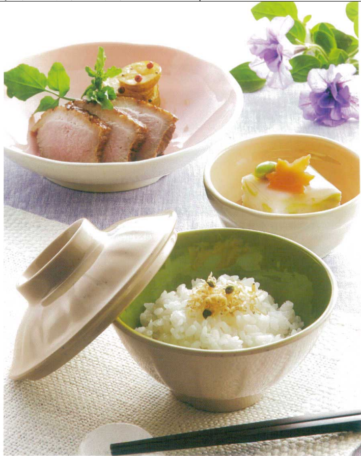
●使用製品 / 面そぎ飯碗(A69AMC)・丸深小鉢小(G119IOC)・丸深皿小(D159IPC)・21cmPBT 箸(H71MBN)