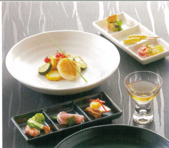
●使用製品 / 23cm 丸深皿 (D258KOH)・三品皿 (D263B / D263KOH)

シンプルモダン 和風 洋風 中華 病院・高齢者 UD・P・カバー 弁当箱 高強化磁器 ピュウフェ中食 テーブルグッズ キッズスクール トレイ