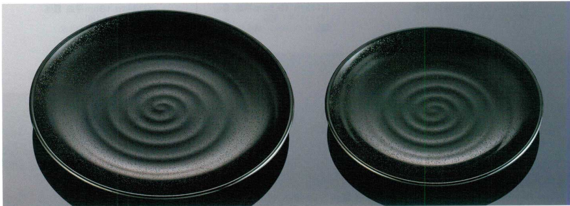
D137B 33cm平皿 黒 TAB 330×34 ¥2,150