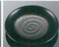
シンプルでお求めやすい「黒」