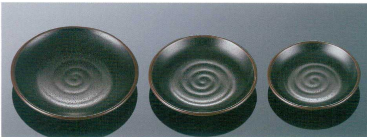
D145TN 16cm平皿 TAB 160×23 ¥1,050 016 ¥370(P253) 組高59