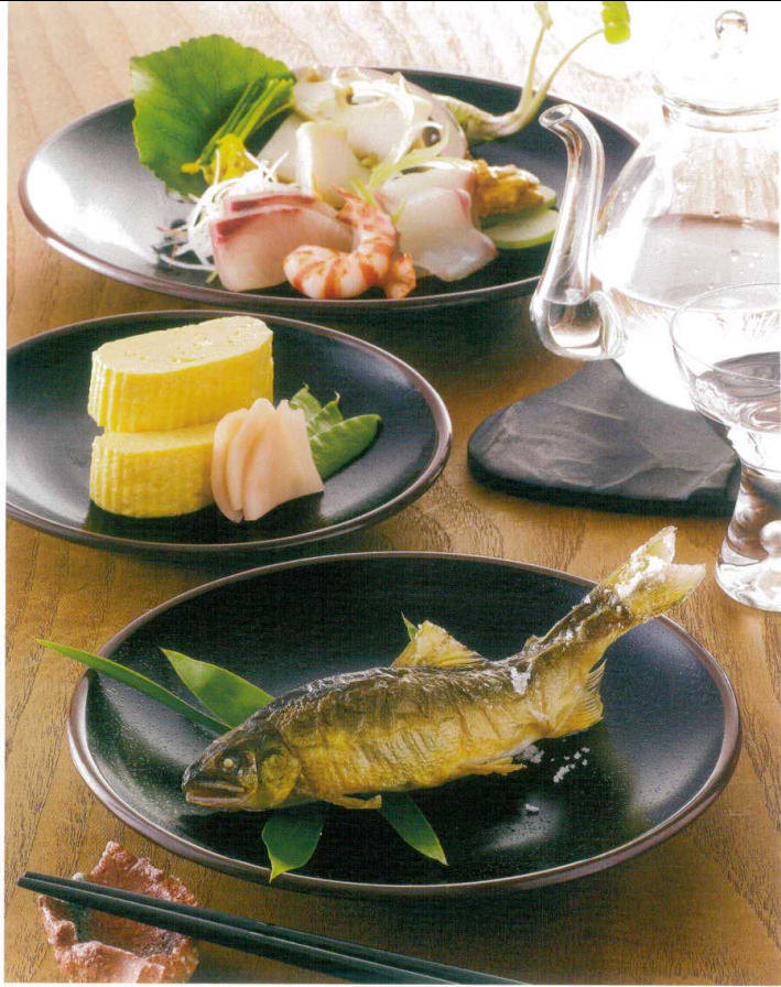
●使用製品 / 18cm平皿(D144TN)・16cm平皿(D145TN)・23.5cm平皿(D141TN)・22.5cmハイロン箸(H32B)