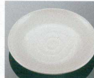
素地に粒材を散りばめた「粉引」