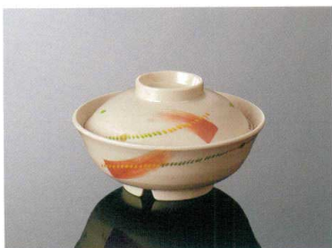
B35AKN 羽反煮物碗 組高80 TAB 身B 137×53(380ml) ¥900 蓋C 119×36 ¥620 013 ¥250(P252) 組高70

シンプルモダン 和風 洋風 中華 病院・高齢者 UDPカバー 弁当箱 高強化磁器 ピコッフェ中食 テーブルグッズ キッズスクール トレー