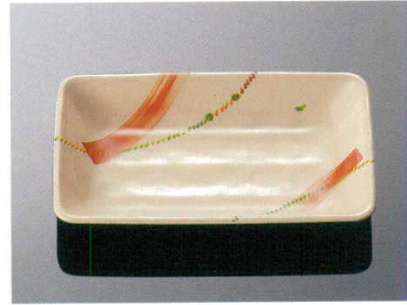
D157AKN 長角皿 小 TAB 182×112×26 ¥1,160 018 ¥390(P254) 組高63