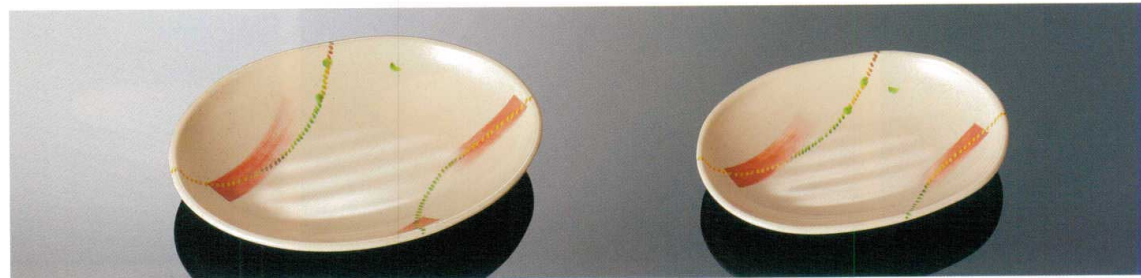
D165AKN 小判皿 大 TAB 優 225×166×36 ¥1,350