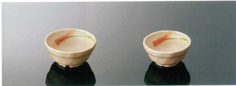
G19AKN 丸深小鉢 TAB 103×49(210ml) ¥730 010 ¥210(P252) 組高63