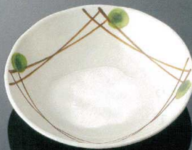
D159MKZ 丸深皿 小 T AB 163×40(400ml) ¥1,200 T B ¥370(P253) 組高76