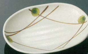
D166MKZ 小判皿 小 T AB 196×144×33 ¥1,190

シンプルモダン 和風 洋風 中華 病院・高齢者 UD・Pカバー 弁当箱 高強化磁器 ビュッフェ中食 テーブルグッズ キッズ&スタイル トレー