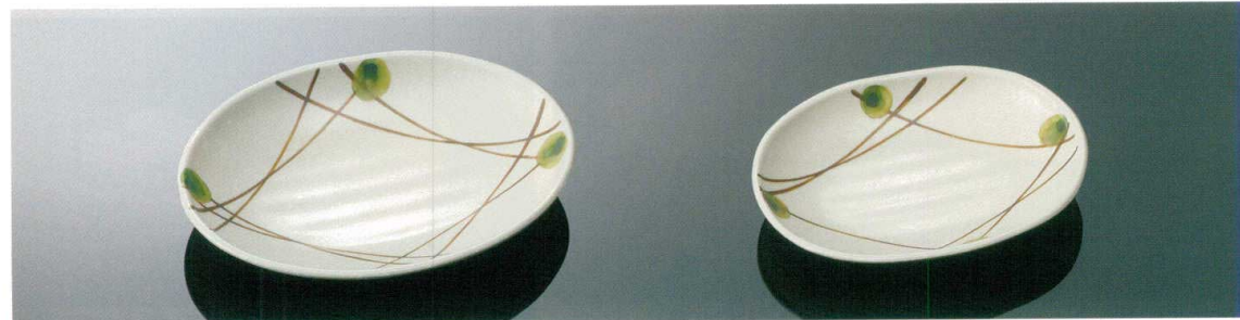
D165MKZ 小判皿 大 T AB 225×166×36 ¥1,400