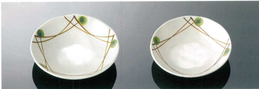
D158MKZ 丸深皿 大 T AB 187×45(590ml) ¥1,450