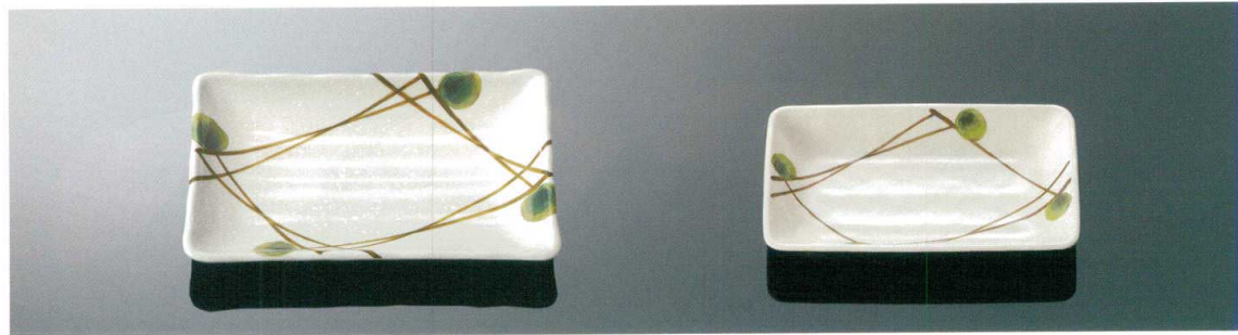
D155MKZ 長角皿 T AB 210×144×25 ¥1,350