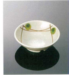
G11MKZ 丸浅小鉢 T AB 113×37(165ml) ¥720 T B ¥220(P252) 組高51