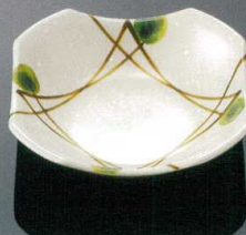
D163MKZ 隅切深皿 小 T AB 133×133×37 ¥900