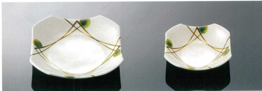
D161MKZ 隅切深皿 大 T AB 185×185×40 ¥1,500