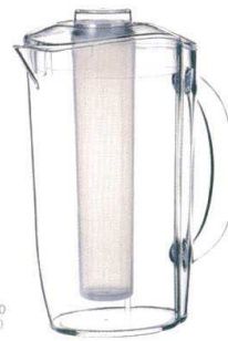
DG-2443 アイストピツチャー FI-4A ¥5,000 180×135(M220)×H270 2700ml (筒状状態)(1×6) MS <TW>