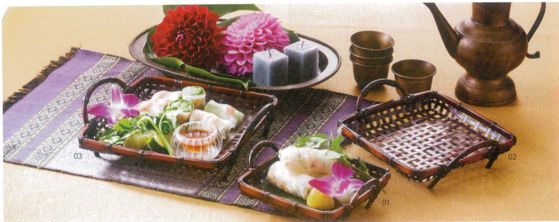
四ツ目角型盛皿(足付)

18-091-01 (30197) 小 2,700円 約14.5×14.5(受皿)×H5.7(4)cm 18-091-02 (30196) 中 2,950円 約18×18(受皿)×H6.7(4)cm 18-091-03 (30195) 大 3,300円 約21×21(受皿)×H7.2(4)cm