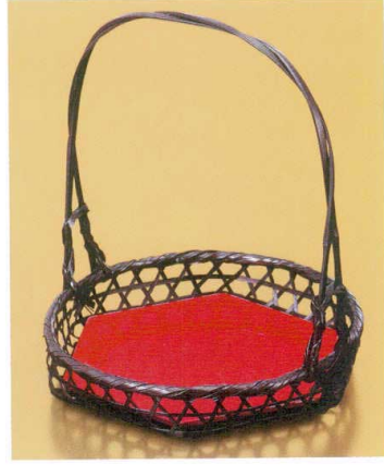
手付盛籠 大(塗板付)

18-091-05 (24407) 3,500円 約φ17×H20.5(4)cm