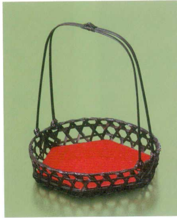
万葉若菜籠(塗板付)

18-091-04 (24202) 2,850円 約φ17×H16.5(3.8)cm