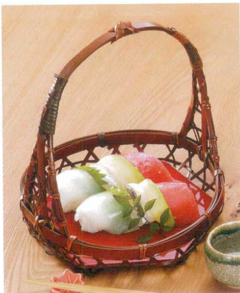
手付盛籠 中(塗板付)

18-091-04 (24202) 2,850円 約φ17×H16.5(3.8)cm