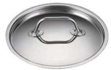
⑥EBM ガストロ 443 銅蓋