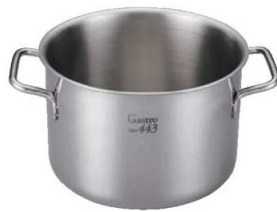
②EBM ガストロ 443 半寸銅鍋 蓋無(目盛付)