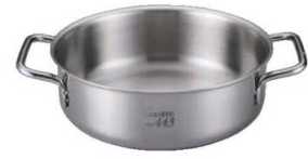
③EBM ガストロ 443 外輪鍋 蓋無(目盛付)