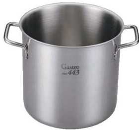
①EBM ガストロ 443 寸銅鍋 蓋無(目盛付)