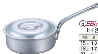
⑤EBM アルミ プロシェフ IH 浅型片手鍋 (目盛付)