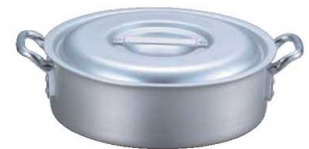
③EBM アルミ プロシェフ IH 外輪鍋