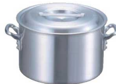
②EBM アルミ プロシェフ IH 半寸胴鍋 (目盛付)