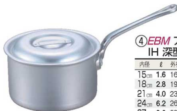
④EBM アルミ プロシェフ IH 深型片手鍋 (目盛付)