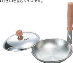
⑥18-10 ロイヤル 縦柄 親子鍋 HSD-160