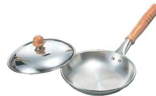
⑦18-10 ロイヤル 横柄 親子鍋 HSD-160