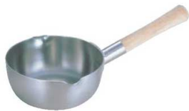
④20-0 ロイヤル 雪平鍋