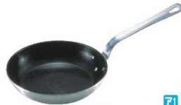
②18-10 ロイヤル フッ素加工 フライパン