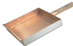
⑧ロイヤル 銅クラッド 玉子焼

外側面は有磁性に優れ、硬度のあるSUS410ステンレスを使用する事でIHクッキングヒーターの高火力による変形を防ぎ、底面で発生した熱を、内側面の熱伝導性に優れている銅が銅全体に熱を伝えます。微妙な火力の強弱に素早く反応ができ、玉子焼きをふっくら作ることができます。