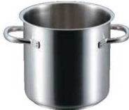
①パデルノ 寸胴鍋 1001 (蓋無)