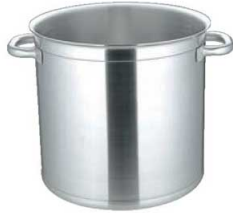
①マトファー／ブウジャ ストックポット 6840(蓋無)