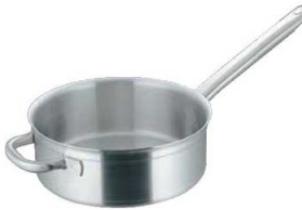
⑤マトファー／ブウジャ ソテーパン 6860

⚠ 14cmは、底面積が極端に小さい為、電磁調理器が十分に反応しない又は、著しく能力が低下する恐れがあります。