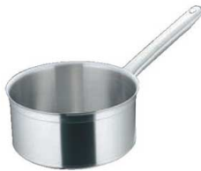
④マトファー／ブウジャ ソースパン 6810 (蓋無)