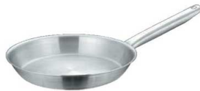
⑦マトファー／ブウジャ フライパン 6850