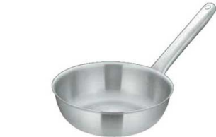
⑥マトファー／ブウジャ テーパーパーン 6865