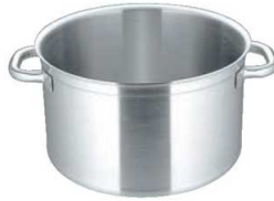
②マトファー／ブウジャ ソースポット 6800(蓋無)