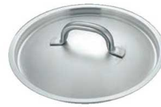
⑧マトファー／ブウジャ 鍋蓋