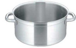
③マトファー／ブウジャ キャセロール 6830 (蓋無)