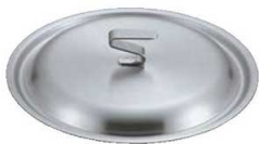
④EBM ビストロ 19cr 鍋蓋