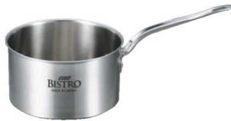
①EBM ビストロ 三層クラッド 深型 片手鍋 (蓋無)

アルミの熱伝導率はステンレスの約13倍。鍋底で受けた熱をす ばやく全体に伝え効率よく加熱するので、時間短縮・コストダウ ンにつながります。 また、熱ムラがなく、IH使用時に底部に見られる「輪状のコゲあ と」も防ぎますので、IHとの相性抜群です。外層は耐久性に優れ たステンレスでガードした理想的な材料です。