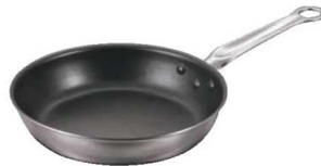
⑤EBM 二層クラッド (アルミ/ステン) フライパン