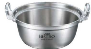
③EBM ビストロ 三層クラッド 料理鍋