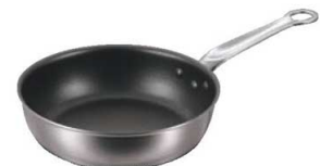
⑥EBM 二層クラッド (アルミ/ステン) いため鍋