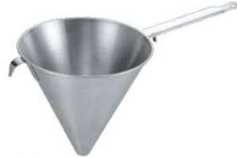
①デバイヤー 18-10 シノア 極細目