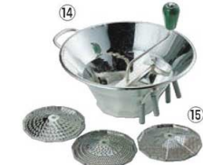
⑭LT スズメッキ ムーラン S3 31cm