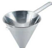
⑤UK 18-8 パンチング スープ漉