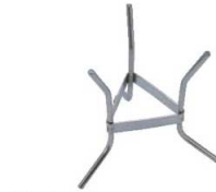
②デバイヤー シノア スタンド 3354-01