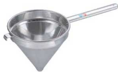
④UK 18-8 スープ漉