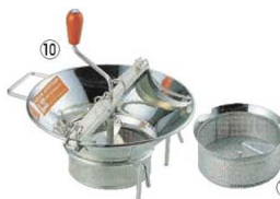
⑩LT スズメッキ ムーラン M515 37cm