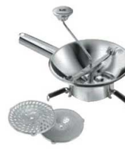
⑰LT 18-10 ムーラン N3002 20cm