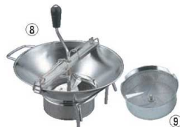
⑧LT 18-10 ムーラン X515 37cm