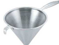
⑥UK 18-8 片手コランダ ー (モナカハンドル)