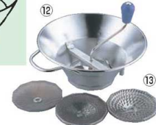
⑫LT 18-10 ムーラン 31cm