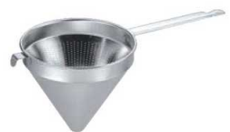
⑦メロディ 18-8 スープ漉