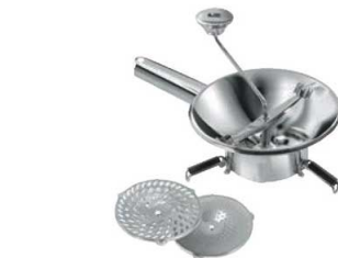
⑯LT 18-10 ムーラン N3004 24cm