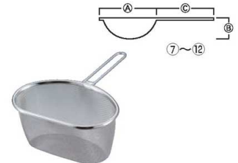
⑨ラステリア 18-8 ハーフストレーナー