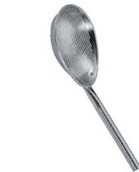
②UK 18-8 パンチング 小判スクイ玉揚