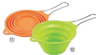
ハンドル付きシリコン ストレーナー ¥1,887(税別)