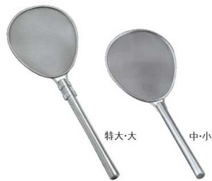
①18-8 バイブ柄 小判型 プロすいのう