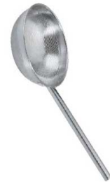
③UK 18-8 パンチング 丸型スクイ玉揚