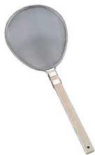
④18-8 木柄 小判型 プロすいのう