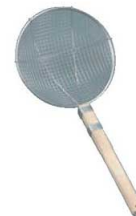
⑥18-8 木柄 丸型 スクイアミ 極荒