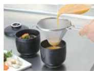
茶碗蒸し作りでとき卵がきれいにこせ、まるやかさアップ