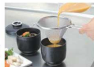
茶碗蒸し作りでとき卵がきれいにこせ、まるやかさアップ