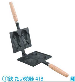
①鉄 たい焼器 418 7820710 ¥6,800 外寸:165×140×335 1個の大きさ:約65×110 重量:1.6kg ●具材がこぼれにくいよう「ふち」を高く設計しました。