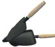
⑤鉄 いか焼器 7819701 ¥5,500 外寸:175×200×380 (木柄含む) 重量:2.3kg 材質:鉄イモノ ●具材がこぼれにくい工夫しました。