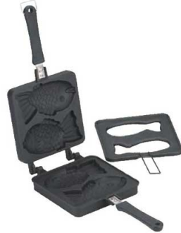
②たい焼きジャンボ いろいろ KS-2787 6499600 ¥7,000 外寸:183×380×H50 1個の大きさ:160×83×H36 重量:2.05kg (具材入れガイド含む) 材質:本体/アルミニウム合金(外面) フッ素樹脂塗膜加工(内面) 底貼り板/ステンレス(厚さ0.7mm) ハンドル/フェノール樹脂 ●具材を入れる際に便利な「具材入れガイド」付