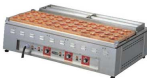
⑦電気 大判焼器 (今川焼器)