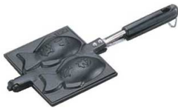
④南部鉄 たいやき 1842900 ¥5,500 外寸:165×370×H40 1個の大きさ:約120×65 重量:1.6kg