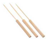
㉓竹たこ焼ピック (100本入) 8226300 ¥2,500 全長:170