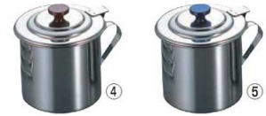
EBM モリブデン 蝶番付ソースポット 外寸 ④赤 ⑤青 価格 10cm φ100×100 0038500 0038510 ¥3,900 12cm φ120×120 0038600 0038610 ¥4,600