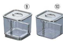
⑨UK ポリカーボネイト 角タレ入 台付 0511200 ¥2,950 外寸:95×95×H90