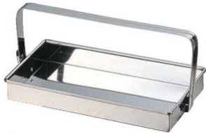
①EBM 18-0 お好み岡持ち 1074300 ¥2,500 外寸:310×170 内寸:300×160×H40