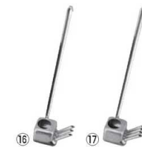
EBM 18-8 ウナギタレカケ 商品コード 価格 ⑯3本口 4819400 ¥1,600 ⑰4本口 4819500 ¥1,850 容量:40cc 全長:270