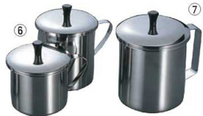
⑥モリブデンソースポット 外寸 商品コード 価格 大 φ102×108 6916100 ¥3,100 小 φ95×85 1074900 ¥1,900