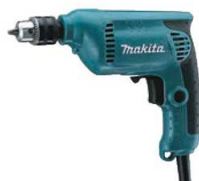
㉗マキタ 電動式ドリル 6412 刃 4911600 ¥11,900 電源:単相100V/450W 定格電流:47A コード長さ:2m チャック範囲:1.5mm~10mm 重量:1.2kg