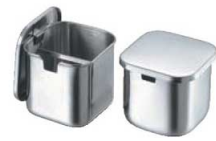
⑧クローバー モリブデン プレス角タレ入 0511100 ¥2,340 外寸:95×95×H85 容量:0.5ℓ ●蓋の裏に引掛金具が付いているので、蓋の置き場所に困りません。 ●タレ切り付で便利です。