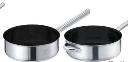
②EBM モリブデンII プラス 浅型片手鍋 蓋無