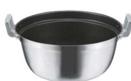
⑤EBM モリブデンII プラス 料理鍋