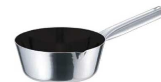
⑥EBM モリブデンII プラス 雪平鍋