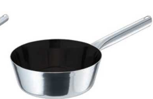
③EBM モリブデンII プラス テーパーパン