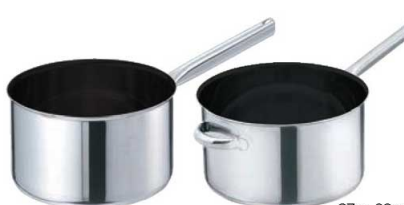
①EBM モリブデンII プラス 深型片手鍋 蓋無

主としてフッ素樹脂コーティングのことを指し、調理したものがこびりつかないようにする加工のことです。よく耳にするテフロン加工とはデュボン社の登録商標で、数あるノンスティック加工の中の1つです。コーティングは使用を続けるうちに劣化していきますが、再加工ができますので、鍋自体も長く使うことができます。