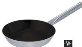
④EBM モリブデンII プラス フライパン