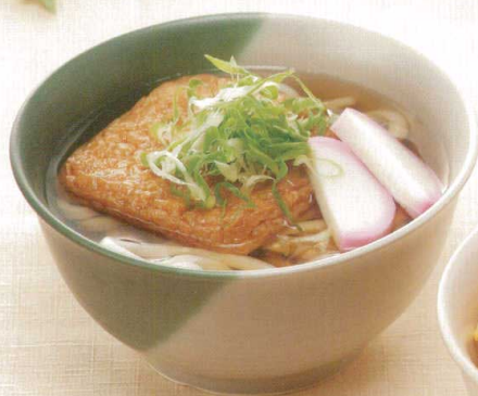
19261-63 塗分け(まつば) ¥1,940 150φ×76h 690cc