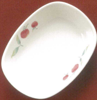
19461-76 ひめりんご ¥1,620 135×102×30h 185cc