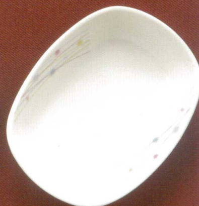
19461-73 はなび ¥1,620 135×102×30h 185cc