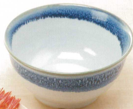
19261-60 青流し ¥1,940 150φ×76h 690cc