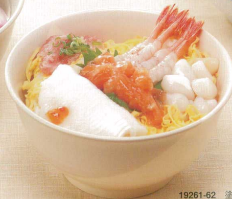
19261-62 塗分け(さくら) ¥2,290 150φ×76h 690cc