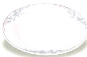
1982-30 23cmスープ皿 ¥2,300 233φ×33h 360cc