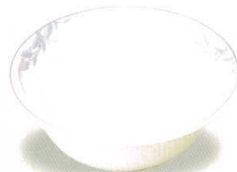
1915-30 サラダボール ¥1,540 150φ×50h 420cc