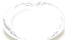
1987-30 16.5cm/バン皿 ¥1,290 166φ×22h