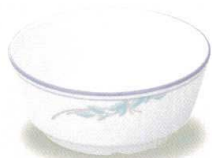
19437-30 多用鉢 ¥1,780 134φ×56h 460cc