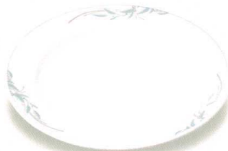
1988-30 21cmデザート皿 ¥1,760 214φ×22h