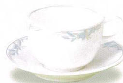
1937-30 マグカップ ¥2,720 C(カップ)¥1,470 S(ソーサー)¥1,250 91φ×115×60h(65h)カップ 235cc 145φ×23hソーサー