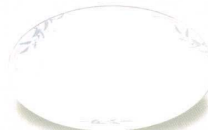
1981-30 19cmデザート皿 ¥1,580 192φ×20h