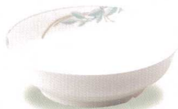
19246-30 N鉢 ¥2,610 166φ×49h 510cc