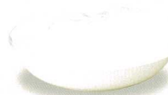
1951-30 ベリー皿 ¥1,170 147φ×31h 300cc