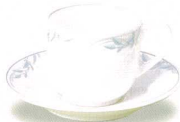
1939-30 コーヒーカップ ¥2,720 C(カップ)¥1,470 S(ソーサー-1937S)¥1,250 76φ×100×64h(70h)カップ 180cc 145φ×23hソーサー