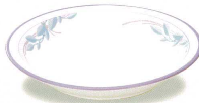
80881-30 カレー皿 ¥2,880 239φ×37h 690cc