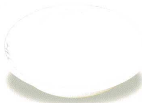
19844-30 クープ皿 ¥2,120 190φ×40h 610cc