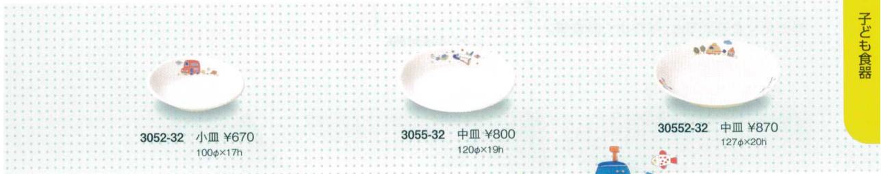
3052-32 小皿 ¥670 100φ×17h