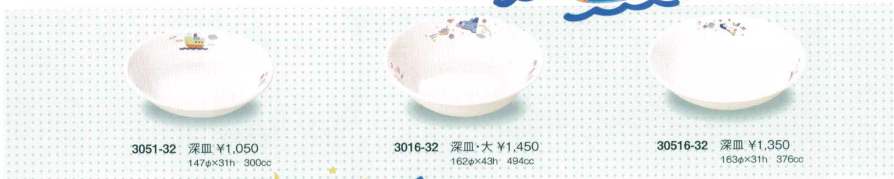
3051-32 深皿 ¥1,050 147φ×31h 300cc