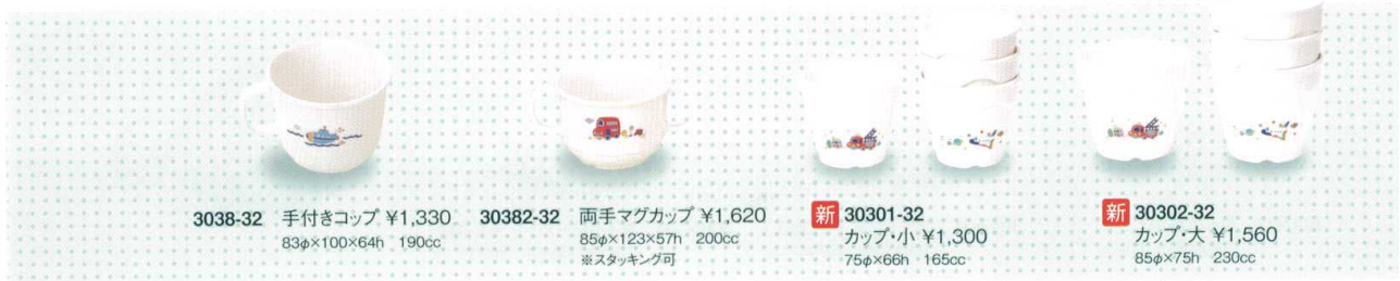
3038-32 手付きコップ ¥1,330 83φ×100×64h 190cc